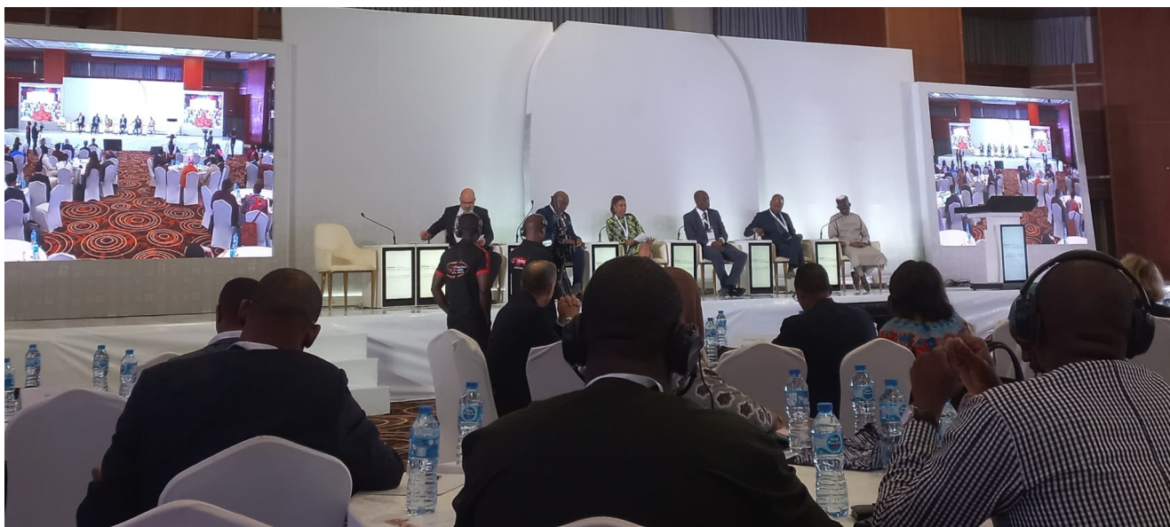
Table ronde sur les solutions que peut apporter le secteur privé aux déplacements internes en Afrique (28-29 novembre) – Lagos

Parmi les défis humanitaires qui se présentent au Sahel central, en particulier au Niger, figurent les tensions politiques grandissantes entre les autorités et l'Union européenne concernant la gestion de l'aide humanitaire. Le gouvernement a critiqué l'UE pour avoir alloué des financements aux ONG qui répondent aux inondations sans le consulter préalablement. Les refus de visas pour les citoyens français et les difficultés rencontrées par les ONG dans l'obtention de leurs agréments représentent les principales préoccupations. Les efforts de plaidoyer se concentrent sur une distinction claire entre l'ordre du jour humanitaire et les objectifs de sécurité fixés par la stratégie de stabilisation de la Commission du bassin du lac Tchad, avec un lobbying intensif en faveur de l'inclusion des ONG au sein de sa gouvernance. Le renforcement de la coordination des ONG au niveau régional demeure une priorité.